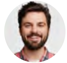
CEO Compañía de combustible y energía

RETOS: Búsqueda de socios confiables, sinergias y monitorización. Maximizar las condiciones financieras mediante el apalancamiento por volumen de varios países.